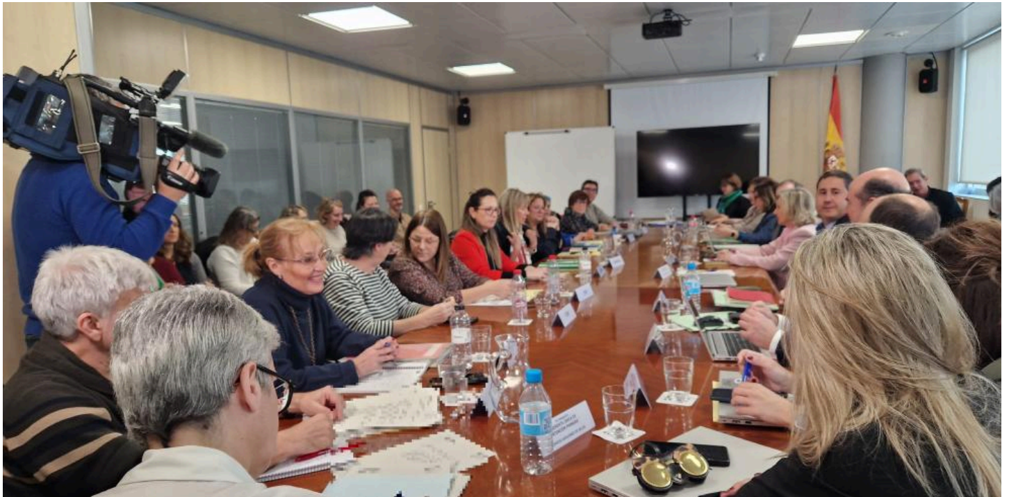
Mesa Sectorial de Sanidad Gobierno de Aragón